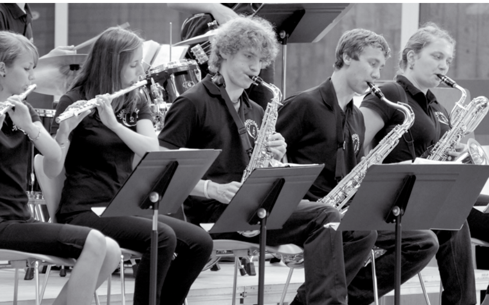
Big Band des St. Benno Gymnasiums