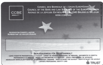
Rückseite mit Feld für die Unterschrift