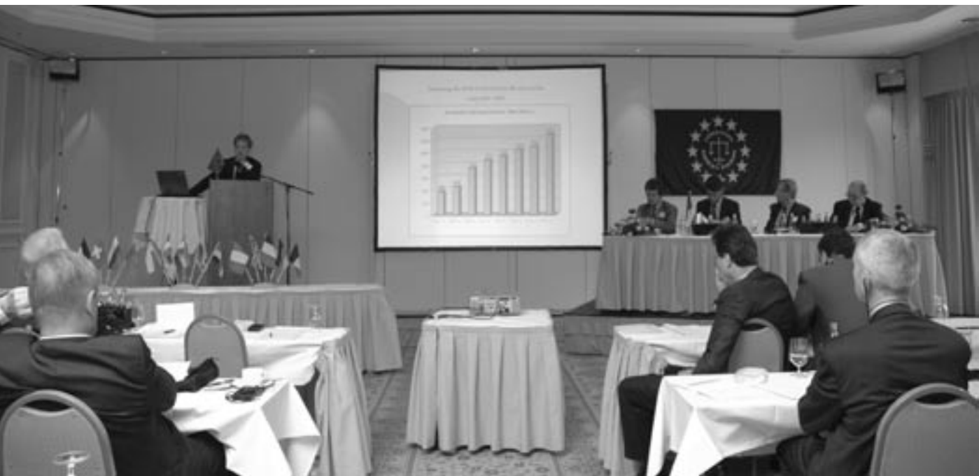
RA Arunas Sarka berichtet über die Situation Anwaltschaft in Litauen